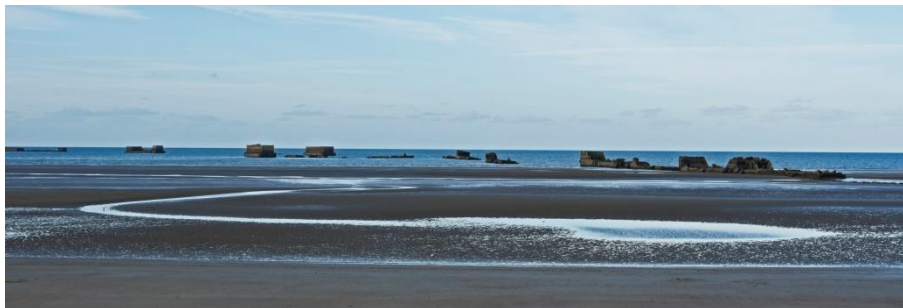
Les pontons à marée basse

Les Allemands occupant tous les ports de la Manche, Churchill décide dès 1942 de construire un port artificiel pour le débarquement allié. Des caissons ( Phoenix ) ou pontons sont alors élaborés en Angleterre, puis remorqués jusqu'à Asnelles afin de former des jetées à l'intérieur desquelles le débarquement s'effectuera. Arrivés sur place, les 212 pontons (longueur : 70m ; largeur : 15 m ; hauteur : 20 m) sont remplis d'eau à l'aide de vannes, reposant ainsi sur le fond de la mer. De la digue d'Asnelles, des vestiges de ces pontons sont encore visibles. Ils formaient un port ( Mulberry B ) d'une longueur d'environ 8 km qui entra en fonction le 14 juin 1944.