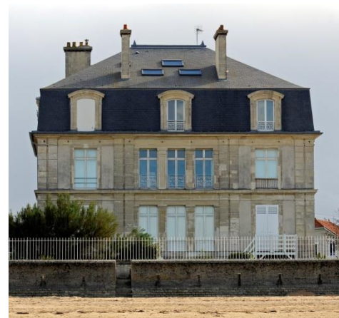
La Maison carrée