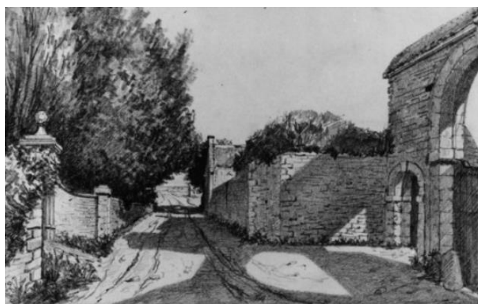
Portail du Mesnil et portail de la ferme

On voit encore de nos jours, au n° 10 de la rue du Débarquement, les deux piliers qui encadraient l'ancienne entrée de la propriété, avant la vente d'une partie du jardin. Ci-dessous, une vue du XIX e siècle montrant l'ancien portail du Mesnil (à gauche) ainsi que celui de la ferme située au n° 9 de cette même rue, dont le mur d'enceinte a été déplacé pour élargir la voie menant à la mer et dont l'entrée charretière a perdu sa partie supérieure.