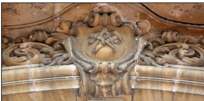
Armes sculptées sur l'ancien fronton du château de Théodore Labbey