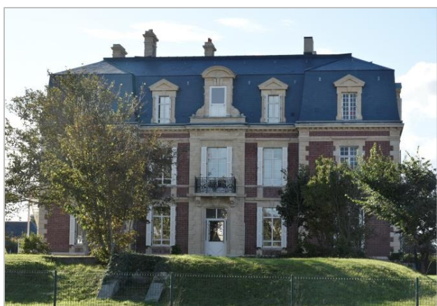
Château reconstruit par Louis Biset-Barraud

En juillet 1919, la mairie apprend qu'une société américaine souhaiterait installer un préventorium à Asnelles, recevant des enfants susceptibles de tuberculose.