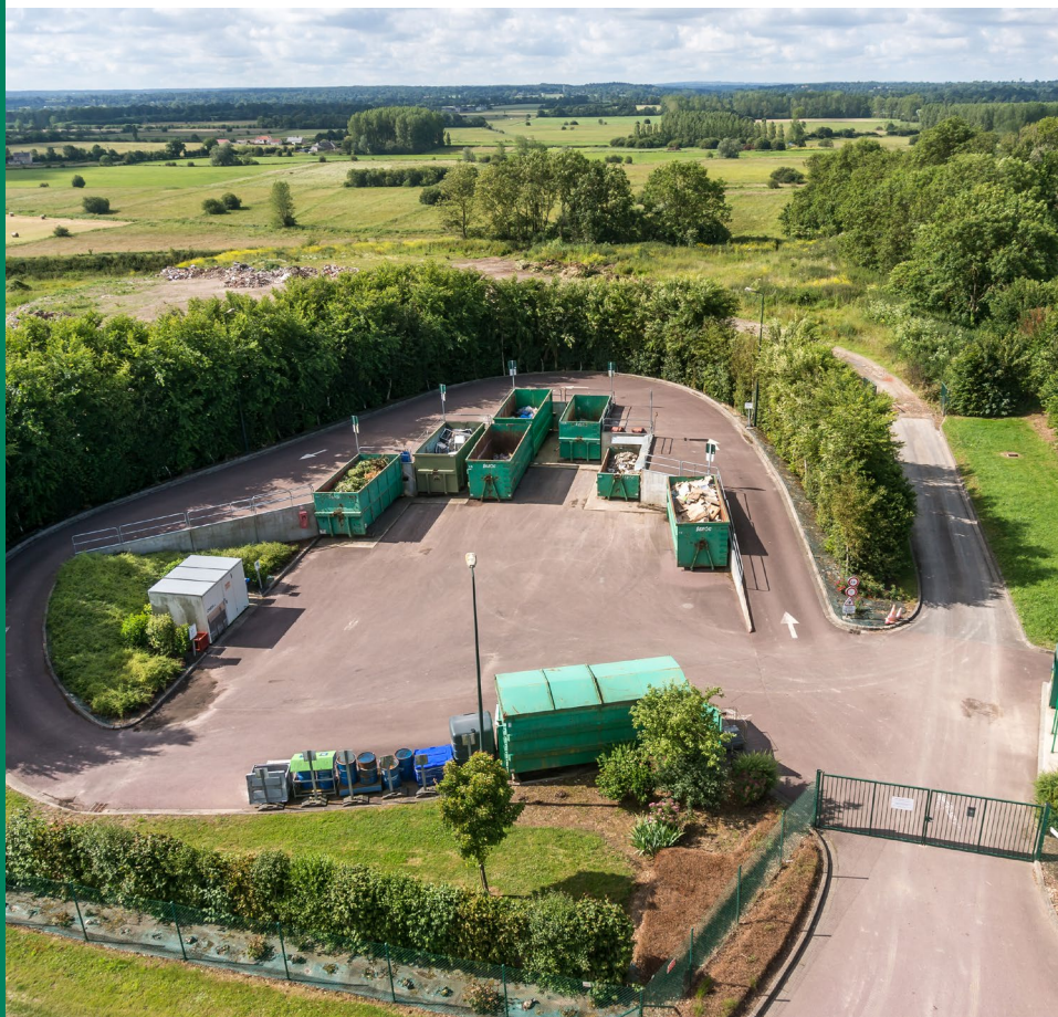
Déchèterie d'Ecrammeville vue du ciel